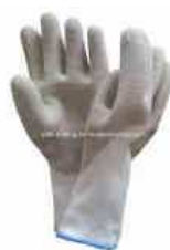
guanti in plastica da lavoro (per la calce)