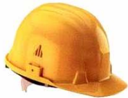
Caschetto da cantiere