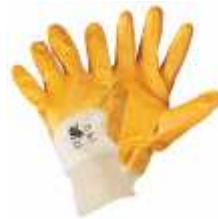
Guanti da lavoro