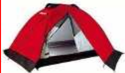
Tenda e tutto quello che occorre per i pernottamenti