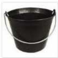
Caldarella (secchio da muratore)