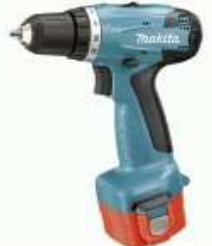
avvitatore a batteria