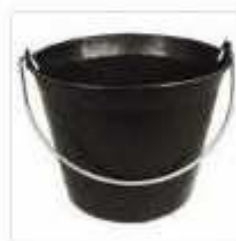
Caldarella (secchio da muratore)

SE NON PUOI PROCURARTI ALCUNI DEI MATERIALI "NON INDISPENSABILI " FACCELO SAPERE