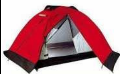
Tenda e tutto quello che occorre per i pernottamenti