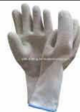
guanti in plastica