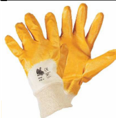
Guanti da lavoro