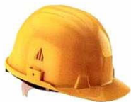
Caschetto da cantiere